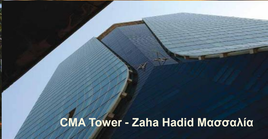
CMA Tower - Zaha Hadid Μασσαλία