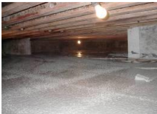
Χαμηλού ύψους κατασκευές

Μεγάλη προστασία οπλισμού, ταχύτερη εφαρμογή, αποφυγή επιχρίσματος