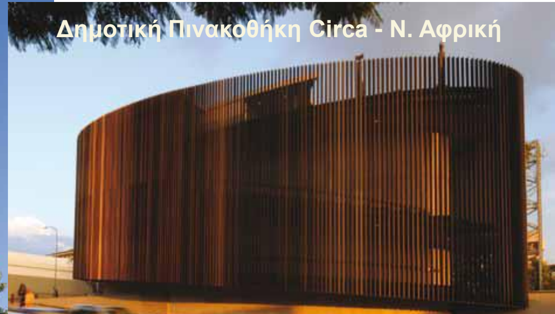
Δημοτική Πινακοθήκη Circa - Ν. Αφρική